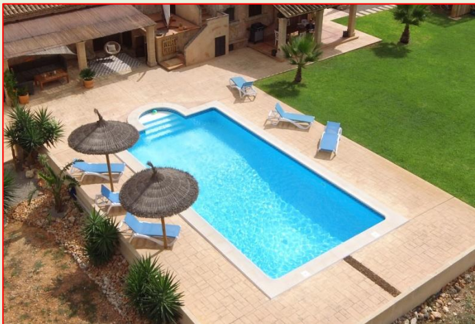
Pool und Outdoor Lounge

Herzstück des Lebens im Freien ist der Frischwasserpool. Er ist mit 5 x 10m großzügig angelegt. Am Pool befindet sich auch die schattige Outdoor Lounge, in der man gemeinsam chillen kann und das Leben im Freien einfach nur genießt.