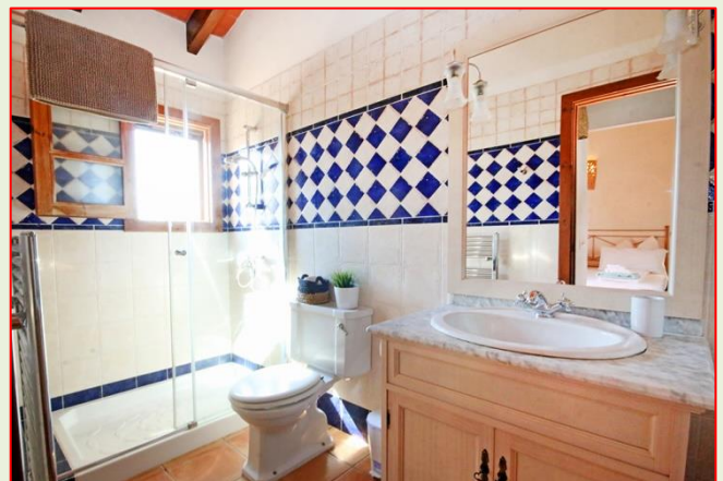
Wohn- und Schlafbereiche, Bäder